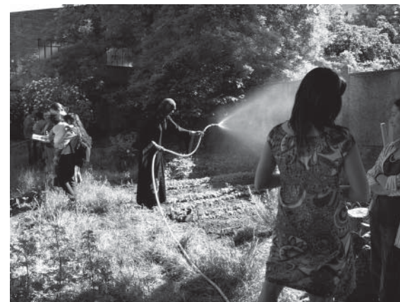
Au Jardin de Montreuil

L'atelier a lieu 4 fois par semaine. Il est particulièrement destiné aux familles monoparentales, bénéficiaires du RMI ou des minima sociaux, et il n'est pas obligatoire. L'objectif est de « favoriser l'insertion sociale et le mieux être personnel par des ateliers de jardinage en groupes pour permettre à un public mis à l'écart des échanges économiques et sociaux d'investir régulièrement une action se situant en amont et/ou en parallèle d'un projet d'insertion professionnelle. Les activités proposées ont une approche technique et expérimentale autour des cultures florales, potagères et aromatiques.