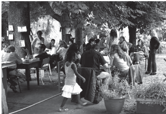
Des Paysages à Partager

« O n est plus assistés, on est producteurs, c'est un outil formidable ! »