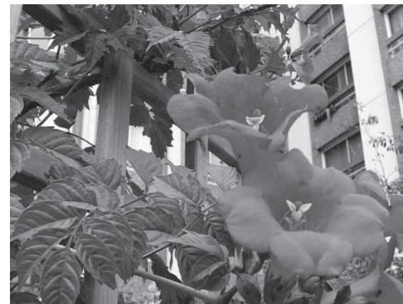
Pendant la floraison

L'objectif est de « développer les capacités d'autonomie des personnes en fragilité psychologique ou physique, pour les réintégrer dans des relations sociales, créer et consolider des réseaux de solidarité entre eux et avec les autres jardiniers. »