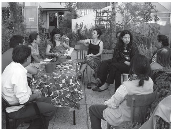
Rempotage et partage