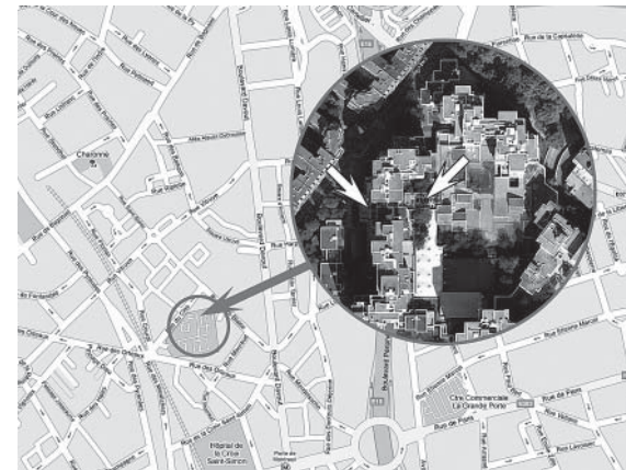
Les terrasses au 16 rue du Clos, Paris XX e

Dans le XII e arrondissement de Paris, sur une friche vers la Mairie, derrière la coulée verte, un projet est en cours de montage également avec un travail avec l'architecte pour dessiner une allée un peu sinueuse traversant le jardin, avec un pavage du chemin en rondelles d'arbres données par le Service de l'Arbre de la Ville de Paris, des tabourets en rondins... les jardins se partagent bien!