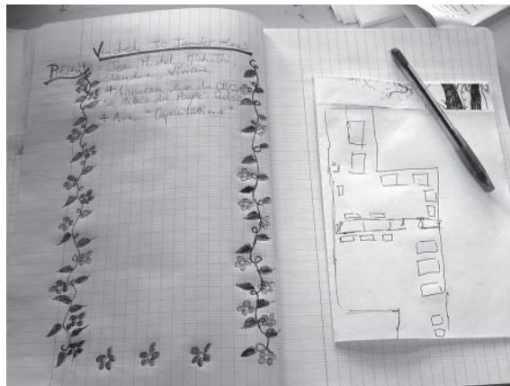
Le cahier de bord des jardins

« C'est une création commune, ce jardin, donc on en est co-responsables, co-gérants. Tout le monde peut en être fier, c'est grâce à tout le monde que cet espace existe, évolue, et est maintenant une vraie joie.»