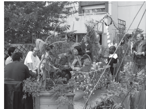
Une après-midi au Jardin du Béton

En 2004, le propriétaire HLM OPAC (Office Public Aménagement Construction) met à disposition une nouvelle terrasse, ce qui amène à 300 m2 de surface.