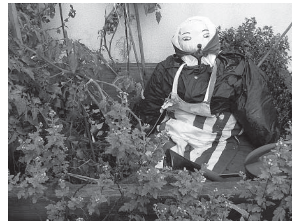
Epouvantail de Claudine

Sur le toit du Gymnase tout proche, rue des Haies, la mairie du XX e a demandé à l'équipe de réaliser un nouveau jardin: il y aura 500m 2 cultivables, avec une serre, et un local de deux pièces. Il sera accessible par ascenseur pour les personnes à mobilité difficile.