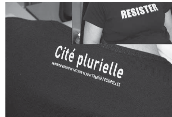
T-shirt Cité Plurielle 2007

Mais ce n'est pas le cas de la presse locale qui couvre l'événement au même niveau que tout autre information, ce qui paraît insuffisant.