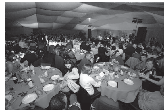
Le Banquet des Cultures clôturé la semaine de Cité Plurielle

Depuis plusieurs années, l'enjeu est d'ouvrir Cité Plurielle à de nouvelles populations. Pour cela, il faut imaginer une multitude de portes d'entrée. Les professionnels ont un grand rôle à jouer dans le repérage des personnes ressources.