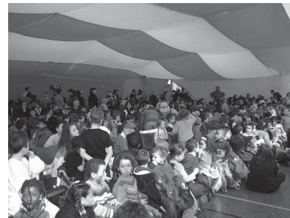
Mercredi pluriel. Projet des Centres de Loisir, dans le cadre de Cité Plurielle

Pour les professionnels, l'entreprise est lourde et chaque année, l'angoisse de ne pas y arriver revient. Et chaque année, ils apprennent à faire confiance au groupe, qui toujours apporte l'énergie et l'intelligence collective qu'ils croyaient devoir fournir seuls. Cité Plurielle apprend aux professionnels à changer de rôle.