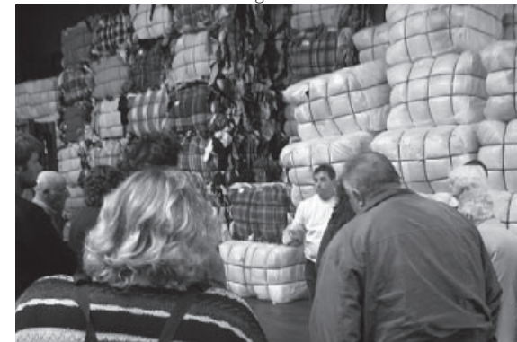
On trie les vêtements en catégories

Les vêtements de bonne qualité sont triés, pliés et vendus dans les boutiques de seconde main de «Terre». Elle a 12 magasins répartis sur la Belgique. Ceux de moins bonne qualité sont vendus aux fripiers en Europe et dans les pays de l'Est. Ceux de qualité inférieure sont vendus aux pays en développement, en Amérique Latine, Asie et Afrique. Ce choix correspond à un besoin de rentabilité, il permet de répondre à une demande de prix très bas pour des matières qui sont susceptibles sur place d'une capacité de valorisation immédiate.