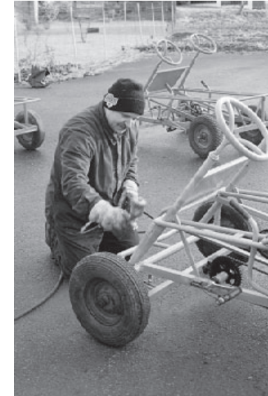
Finition des cuistax, les vélos à 4 roues

Le livret Capacitation Citoyenne de «Terre», "l'entreprise c'est nous" est téléchargeable sur le site Internet www.capacitation-citoyenne.org et détaille bon nombre des aspects présentés ci-dessus.