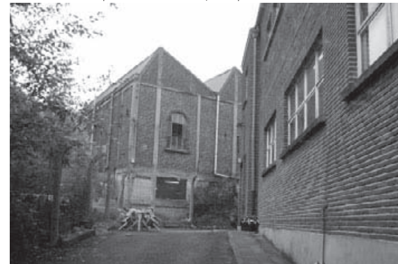
Terre, de la brique comme une fabrique

C es expériences montraient différents moyens de réunir des financements, alternatifs à la subvention institutionnelle, pour des actions solidaires.