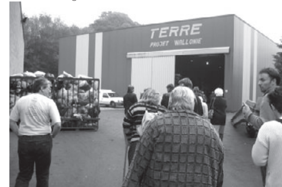
Devant le hangar du tri

Il ne s'agit donc, bien sûr, pas d'un état définitif, ni d'un tour complet de la question, mais d'un "instantané" des réflexions des participants, à partager avec les autres groupes et interlocuteurs, pour faire fructifier efficacement le débat lors de la prochaine rencontre.