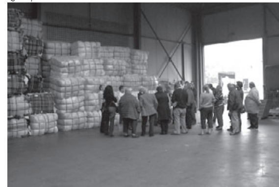
Quelques ballots dans l'atelier

S'il constitue une réelle entité économique créatrice de plusieurs emplois, il est aussi un lieu d'échange et de coopération entre divers acteurs. Il est un outil au service des personnes souhaitant conforter leur rôle d'acteur du développement local, un moyen pour les associations du territoire d'être mobilisées pour accroître leur efficacité et leur développement.