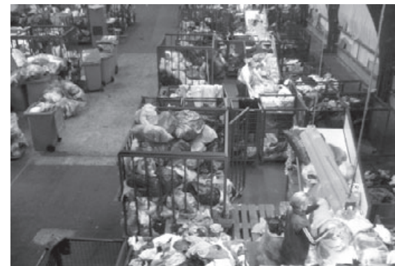
L'atelier de tri

Actuellement, il existe différents sites d'exploitation en Belgique: le siège social se trouve à Herstal avec le plus important centre de production, un autre à Vivegnis (pas loin de Liège) et le dernier à Fontaine-l'Évêque. Certaines des filiales sont des sociétés anonymes à finalité sociale, SAFS. C'est un statut qui n'existe pas en France: il s'agit de sociétés qui agissent sur le marché dans l'optique de l'intérêt général. Chaque salarié participe à l'assemblée générale, sous réserve d'en faire la demande et après un an d'ancienneté dans l'entreprise.