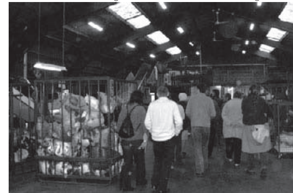
L'atelier de tri, un étrange zoo où les tissus sont en cage

Depuis la création, nous essayons de nous faire connaître et, récemment, de créer des outils d'aide à la vie associative.