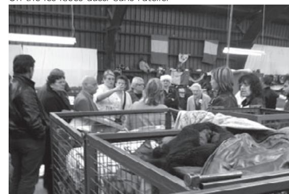
On trie les idées aussi dans l'atelier

L'objet de Cap Berriat est de tenir un rôle d'intermédiaire entre les jeunes et les institutions. Elle œuvre à faire reconnaître des projets de jeunes auprès de diverses collectivités (communes, département, région), et pas uniquement d'un point de vue financier.