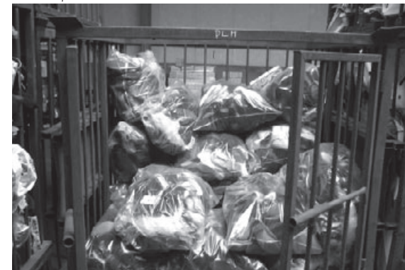
Prêts à partir vers le Sud

D'où l'importance de trouver des formules plus souples d'attribution de financements, le principe de Budget Participatif pouvant être éclairant à cet égard.