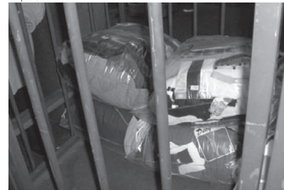
Repus, les sacs dorment

« les politiques culturelles, c'est les acteurs culturels, qui les font, pas les politiques »