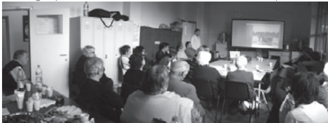
11h le groupe rassemblé dans la salle de réunion de l'entreprise