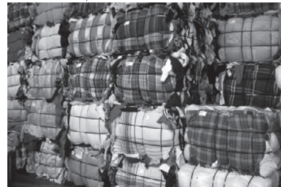
Des murs de récupération

La question initiale serait: si l'on doit avoir recours au financement public, c'est pour être davantage actifs et efficaces. Mais comment concilier la survie de l'outil qui se met alors en place (en particulier les emplois), avec la nécessité fondamentale de maintenir le cap, l'objectif de départ? Bien sûr, si le caractère vital de l'action est reconnu par les pouvoirs publics, on a une meilleure position dans le rapport de forces. Mais il y a une multitude d'initiatives plus modestes, un foisonnement d'actions qui s'adaptent davantage aux particularités des besoins et à la spécificité des acteurs. Pour faire vivre nos projets, doit-on se résigner à s'adapter, voire à pervertir l'intention initiale pour pouvoir accéder aux moyens qu'apportent les financements?