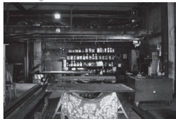
Tout bien rangé

Nous nous sommes posé la question de savoir si notre positionnement est juste à ce sujet: bien sûr nous avons la légitimité de tout humain de monter des projets collectifs.