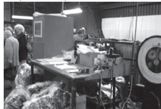
Les expériences ont du poids

Tous les 10 jours, un des membres, par tirage au sort, reçoit la somme mise de côté et peut alors réaliser un projet.