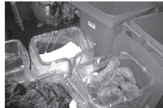
Avant fermeture (des sacs)

Le rapport des associations naissantes aux institutions est souvent un rapport de forces. « C'est un combat et on doit s'imposer » . La marge de manœuvre des associations dépend du minimum sous lequel elles ne descendront pas. « Quel est ce minimum ? »