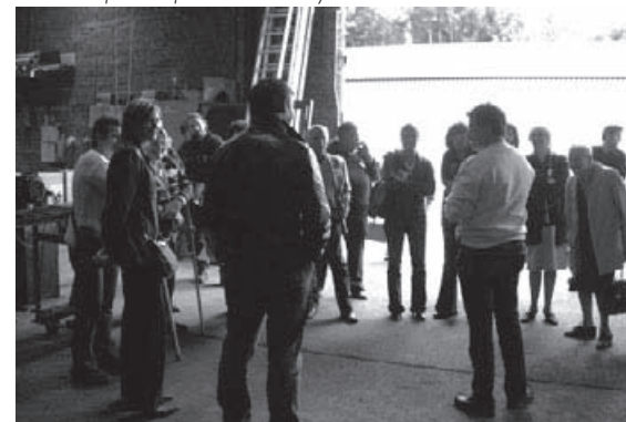
... visité par Capacitation Citoyenne

EN.CO.RE s'est chargée de proposer un soutien aux militants associatifs par de nombreuses réunions de réseau, des débats publics autour de la vie associative et du développement local, ainsi que par l'expérimentation d'outils solidaires construits collectivement, à partir des besoins exprimés par les petites associations locales.