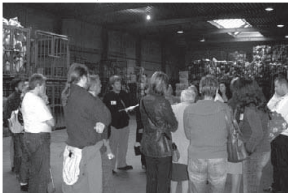
On discute sur le tas, sous les tas

Ce groupement d'employeurs s'adresse aux associations qui participent de diverses manières au développement local et solidaire du territoire. Sont prioritaires les petites structures œuvrant dans les champs du lien social et de l'insertion socioprofessionnelle, de l'économie solidaire et de l'action culturelle.