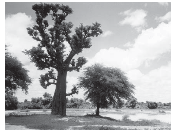
Baobab sur la route de Kayes.