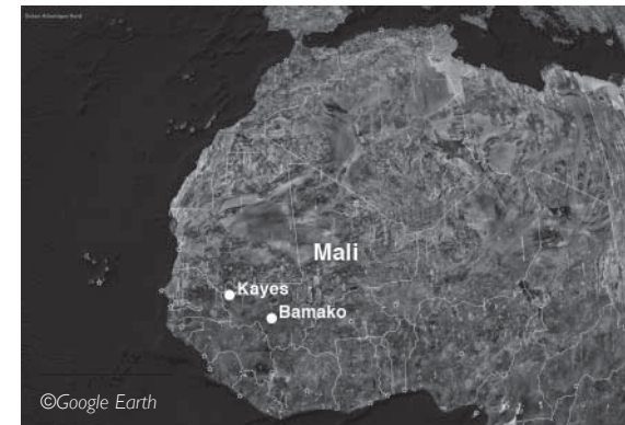
Kayes, à l'ouest du Mali

K ayes N'di (le petit Kayes) est un quartier de Kayes, deuxième ville du Mali avec environ 80 000 habitants, proche du Sénégal, de la Mauritanie, de la Guinée, et traversée par le fleuve Sénégal. Ville carrefour, elle a été capitale du Soudan Français pendant la colonisation. Bamako est devenue capitale à l'indépendance et, depuis, de nombreux Kayésiens émigrent. Ils forment la première population d'origine malienne de France, et notamment à Montreuil-sous-Bois, en Seine-Saint-Denis.