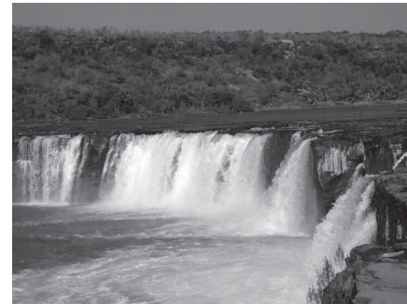
Les chutes de Félou

La ville est constituée du centre, des quartiers autour et de multiples villages dont certains sont temporaires: les éleveurs, de vaches en particulier, se déplacent là où ils peuvent trouver de quoi faire brouter le bétail, puis partent ailleurs, deux ou trois ans après. Ils construisent des cases sommaires et peu résistantes, et les abandonnent lorsqu'ils s'en vont.