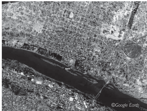
Kayes vu d'avion (3km).

Mais ils réalisent aussi la complexité du montage d'un tel projet, financière, matérielle et humaine, et qu'il va leur falloir beaucoup de patience, d'endurance et de résistance, face à la résignation, la suspicion, la lenteur des démarches.