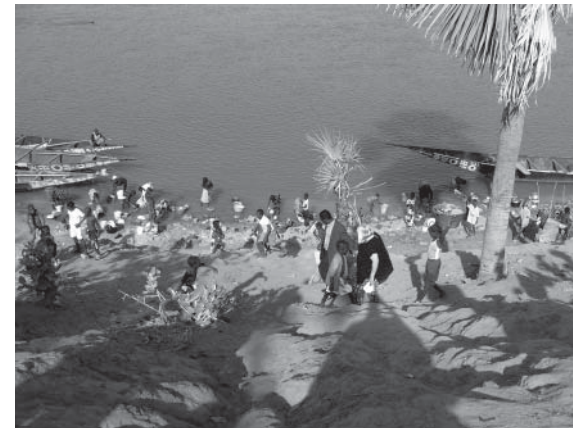
Pêcheurs, pirogues et baigneurs au bord du fleuve Sénégal.

Le centre Fasso permettra de développer le tourisme dans cette région à découvrir. Elle est desservie par la ligne de chemin de fer de Bamako à Dakar et par une toute nouvelle autoroute reliant également Bamako à Dakar. Il y a des sites très intéressants à visiter, les chutes de Félou et de Gouina sur le fleuve Sénégal, le fort colonial français de Médine (qui a protégé une partie des stocks d'or de la Banque de France pendant l'occupation).