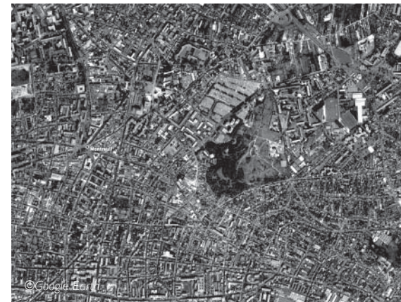
Montreuil vu d'avion (3km).