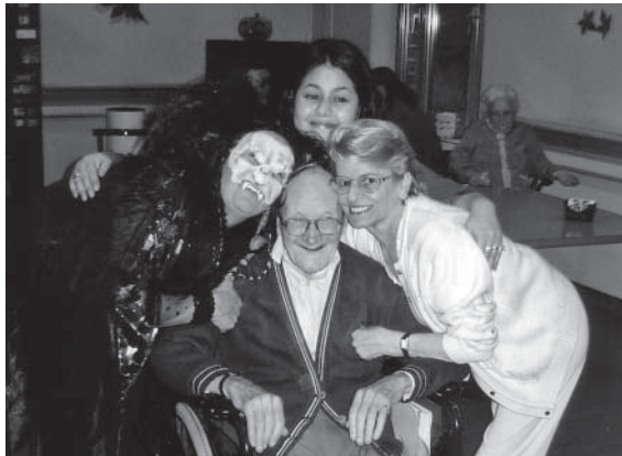
Gedeelde vreugde naar meer solidariteit

H et delen van de kamers is een gevoelig onderwerp dat vaak in de gesprekken terugkomt.