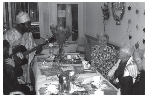
Een honderdjarige verjaart: dat wordt gevierd

Bepaalde medewerkers, die zich bewust waren van het belang van deze ruimte, hebben ook een belangrijke rol gespeeld. Tot grote opluchting van de bewoners ging enkele maanden later de cafetaria weer open en werd er extra personeel ingezet voor de werking en de animatie.