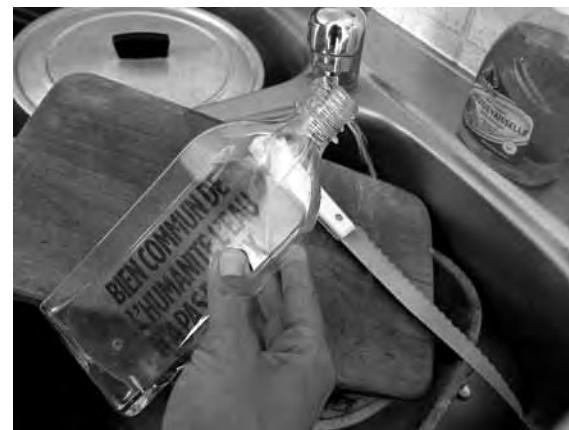
Sensibilisation... active, la Feuille d'Eau