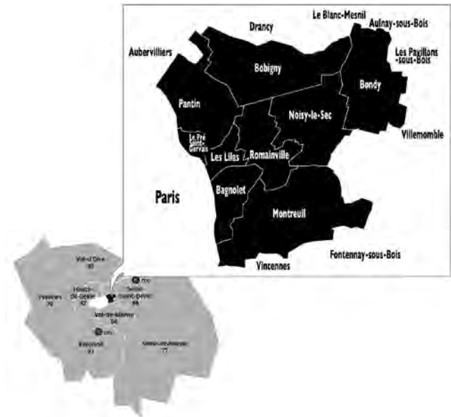
Est Ensemble, au sein du SEDIF

Le SEDIF délègue ce service public essentiel à une seule et même multinationale : Veolia Il s'agit d'un contrat "de régie intéressée", qui s'avère particulièrement avantageux pour l'entreprise, beaucoup moins pour les usagers : l'eau de la banlieue parisienne est parmi les plus chères de France.