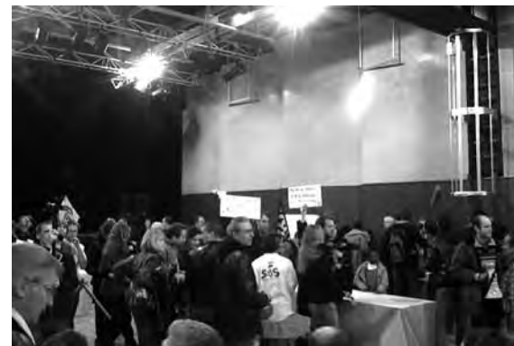
au Conseil Communautaire de "Est Ensemble" /

Cela a laissé l'espoir aux opposants de voir le débat reprendre avec une meilleure information sur les tenants et les aboutissants de la privatisation.