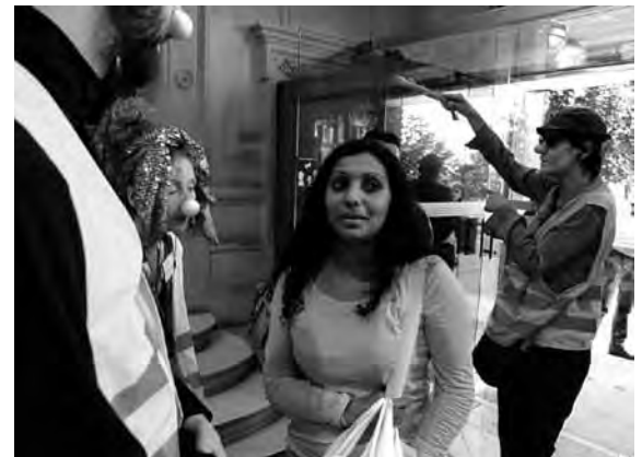
Les poireaux, détecteurs d'eau publique

Elle a voulu "aider" les organisateurs à contrôler que personne n'apporte d'eau publique, strictement interdite à Est Ensemble et plus encore à Pantin. Armés de poireaux détecteurs d'eau, ils fouillèrent le public.